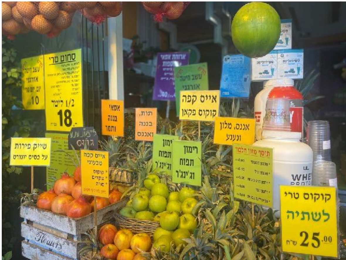
Les prix augmentent en Israël – l'économie souffre des conséquences de la guerre

le nombre de contribuables car, en Israël, le seuil pour le paiement de l'impôt sur le revenu est relativement élevé en raison des très nombreuses exemptions à cause desquelles seulement 20 pour cent de la population paient 80 pour cent de l'impôt sur le revenu”.