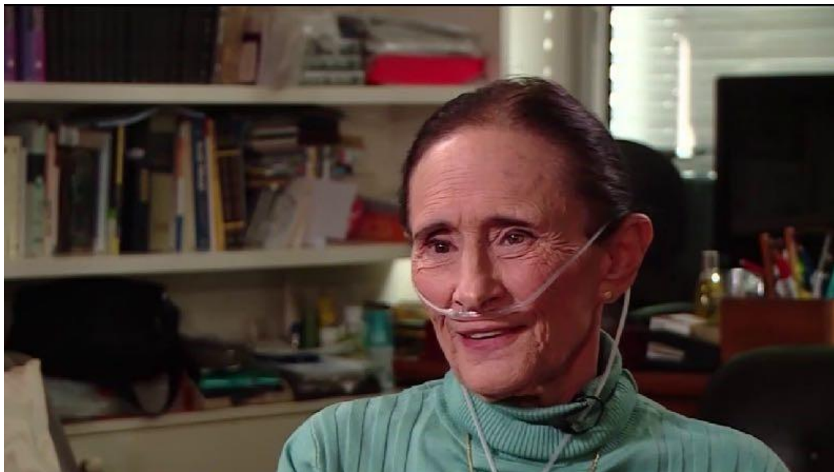
Yaël Dayan lors d'une de ses dernières interviews par 24NEWS français