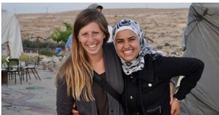
L'institut Arava se bat pour la coexistence en Israël

On peut lire sur le site Internet de l'institut que sa tâche consiste „à faire face aux défis écologiques du Proche-Orient avec des solutions novatrices favorisant la paix et un avenir durable pour la région en promouvant une préservation de la nature au niveau supranational".