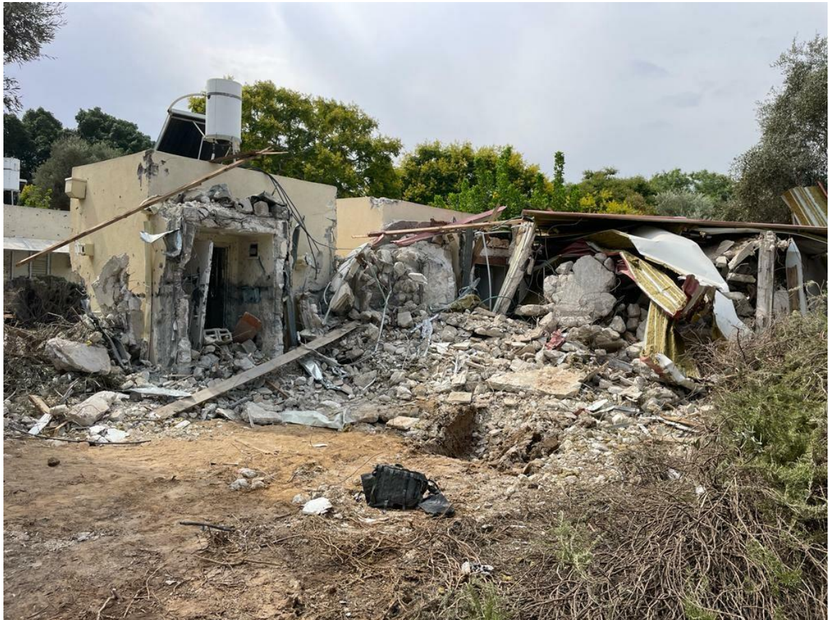
Les destructions dans la région d'Eshkol sont énormes