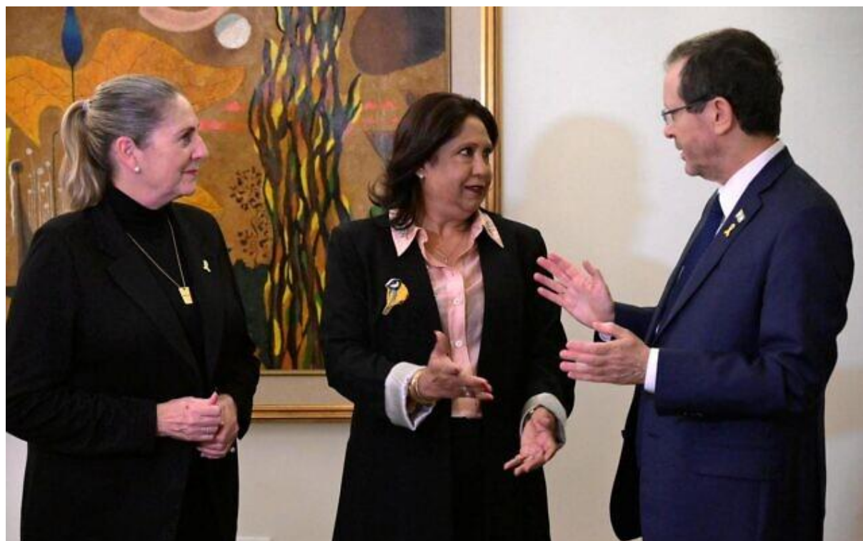
L'envoyée spéciale des Nations Unies pour les violences sexuelles liées aux conflits, Pramila Patten, a rencontré le 29 janvier la Première dame Mi'hal Herzog (à gauche) et le Président Isaac Herzog à Jérusalem

Une envoyée des Nations Unies qui s'est rendue en Israël lundi a demandé aux victimes des viols commis le 7 octobre par le Hamas de „briser le mur du silence“ afin d'aider la justice.