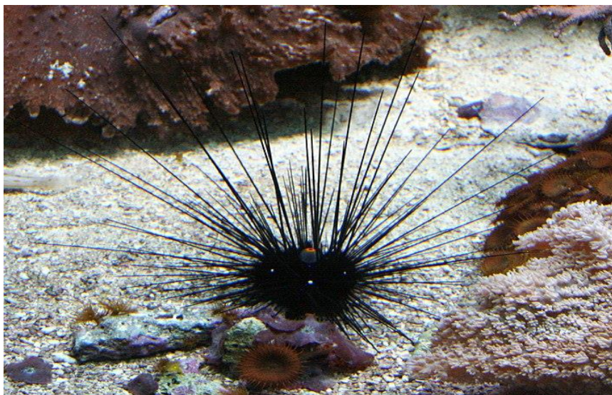
Un oursin noir

« Actuellement, nous ne pouvons rien faire pour l'empêcher » a déclaré Bronstein. Nous disposons d'un « créneau très étroit » pour obtenir une population isolée ou des effectifs nicheurs qui restent dans un autre endroit et pourront, du moins l'espérons-nous, être réinstallés ultérieurement. Les chercheurs ont également signalé qu'un rapport a été présenté aux autorités israéliennes de l'environnement et que des mesures d'urgence pour la protection des récifs de corail sont en cours d'étude.