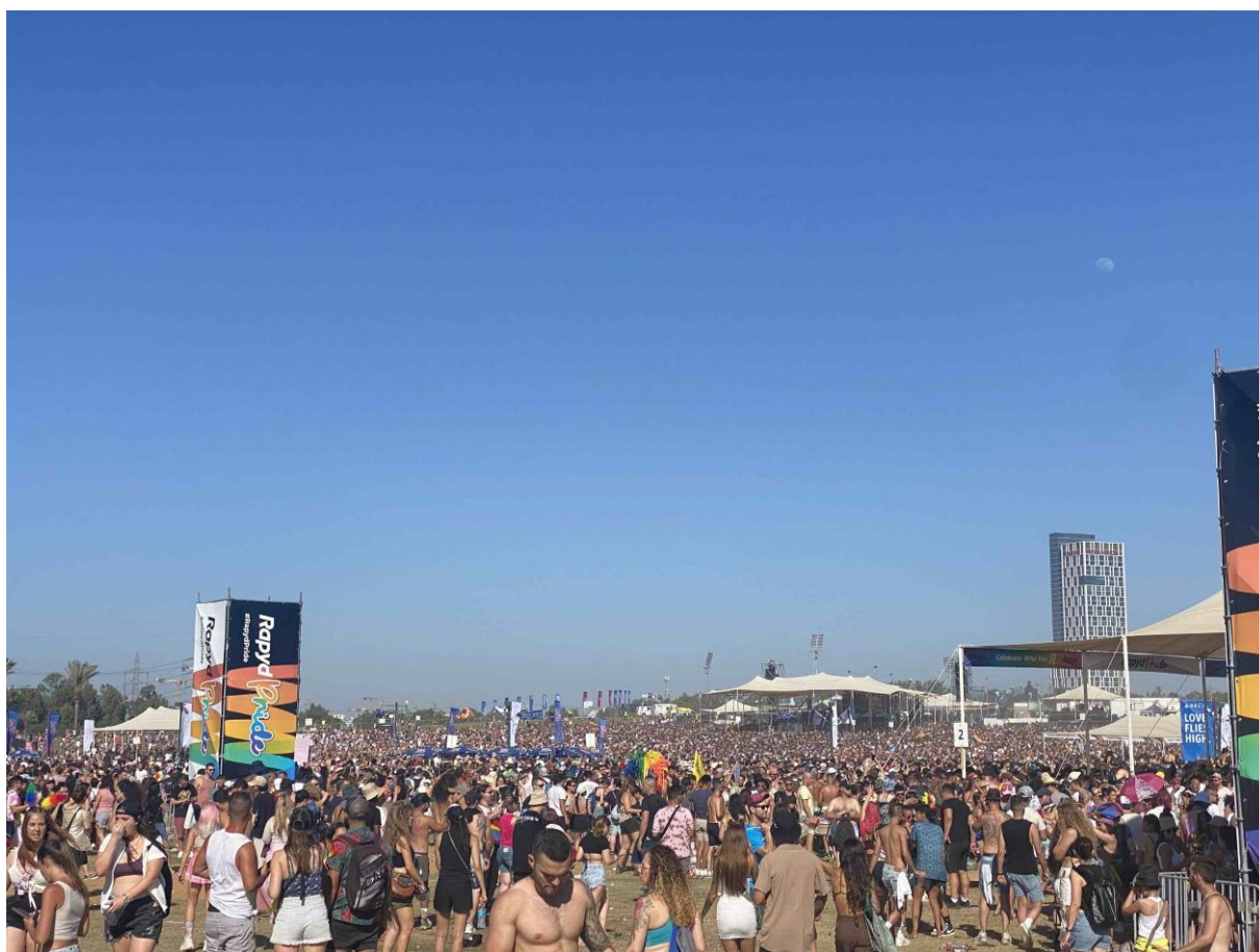
Parade de la fierté à Tel-Aviv en 2022