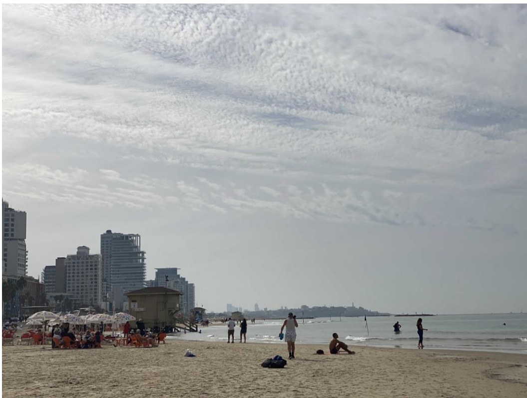
Une plage de Tel-Aviv en décembre. Le beau temps ne peut toutefois pas compenser le fait que le jour est proche où plus personne ne pourra s'offrir le luxe de vivre dans cette ville

A la lumière de ces faits on est en droit de se demander pourquoi les Israéliens et notamment ceux vivant à Tel-Aviv ne sont pas plus furieux et mécontents ? Probablement parce que la pandémie et les élections à répétition jusqu'à la formation d'un nouveau gouvernement les ont épuisés.