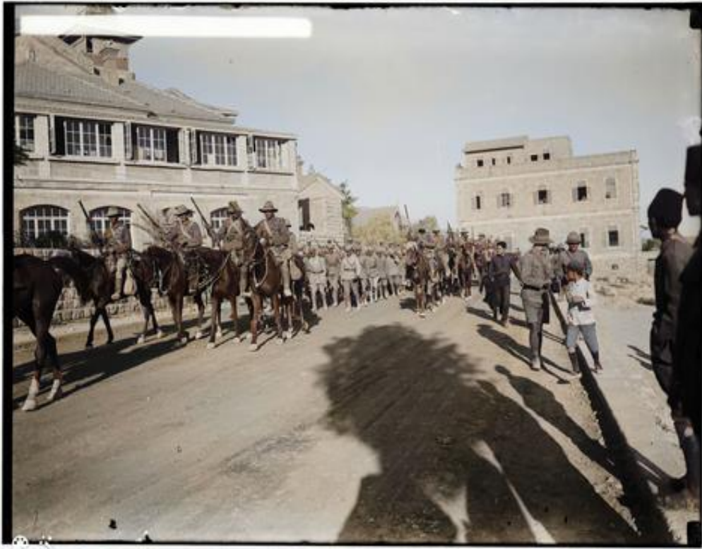
Prisonniers de guerre allemands à Jérusalem pendant la première guerre mondiale (1917)

Vos dons permettent la publication hebdomadaire d'ENTRE LES LIGNES. Nous espérons vous compter bientôt parmi nos bienfaiteurs et nous permettons de vous indiquer nos coordonnées bancaires : IBAN: CH82 0873 1544 3516 4200 1 - titulaire du compte – AMUTA, CH-8702 Zollikon Banque: Bank Linth LLB AG, Zürcherstrasse 3, CH-8730 Uznach - SWIFT/BIC: LINSCH23XXX