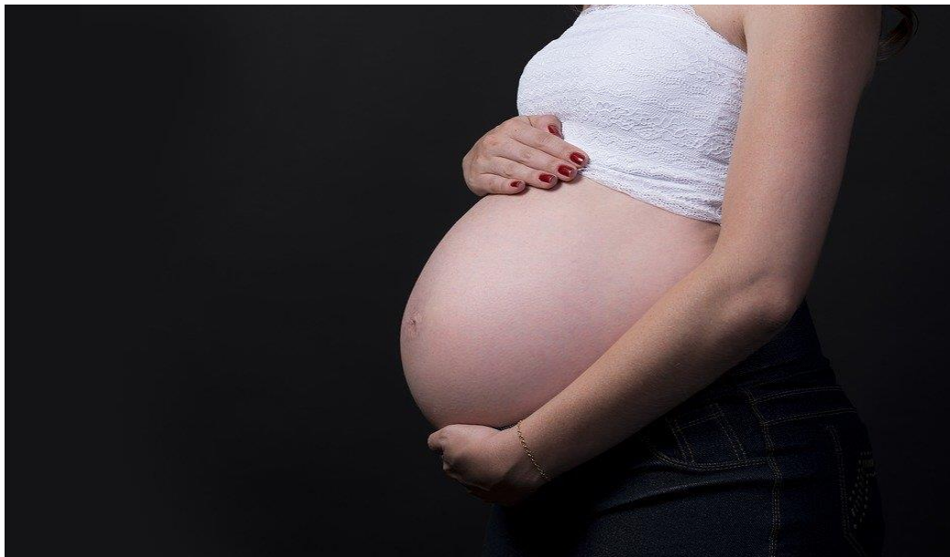
La grossesse est une chose merveilleuse quand elle est souhaitée