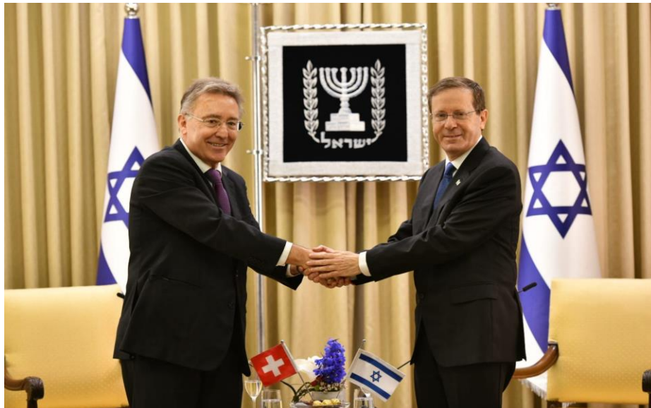
Le nouvel ambassadeur de Suisse, Urs Bucher, avec le Président de l'Etat d'Israël, Isaac Herzog