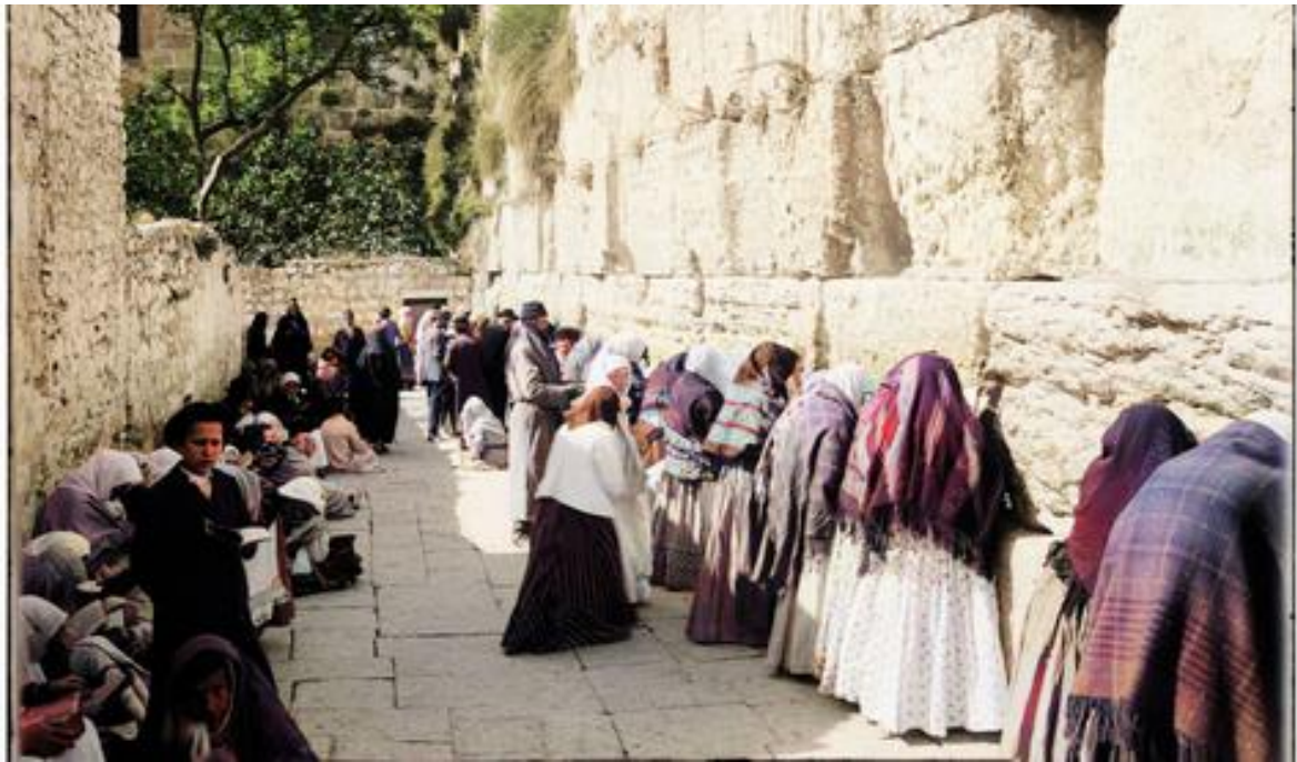
Hommes et femmes priant ensemble devant le Mur des Lamentations dans les années 1920