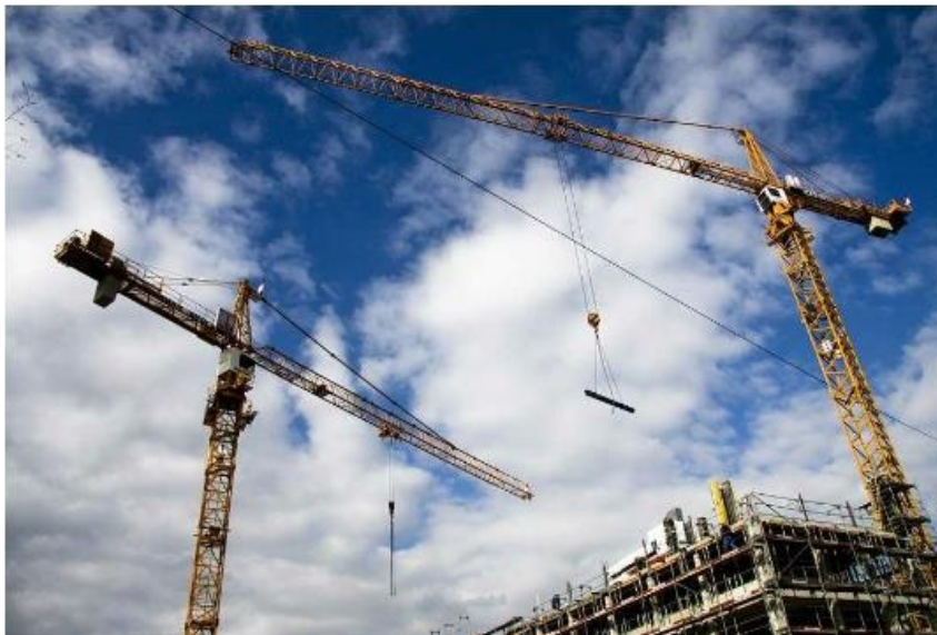
Encore plus de projets de construction : Israël a besoin de plus de logements

Le gouvernement vient de présenter un programme ambitieux pour modifier la donne. Entre 2022 et 2025, 500 000 nouveaux logements vont être construits et la taxe pour les achats aux fins d'investissement va être portée à 8 pour cent tandis que celle pour les constructions sur des terrains privés va être abaissée. Par ailleurs, le gouvernement veut interdire l'utilisation d'appartements privés à des fins professionnelles dans tout le centre d'Israël, à l'exception des jardins d'enfants ainsi que leur utilisation pour l'hébergement de tiers contre paiement (par exemple via Airbnb).