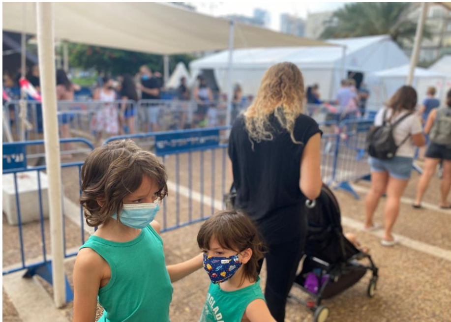
Enfants faisant la queue pour se faire tester à Tel-Aviv