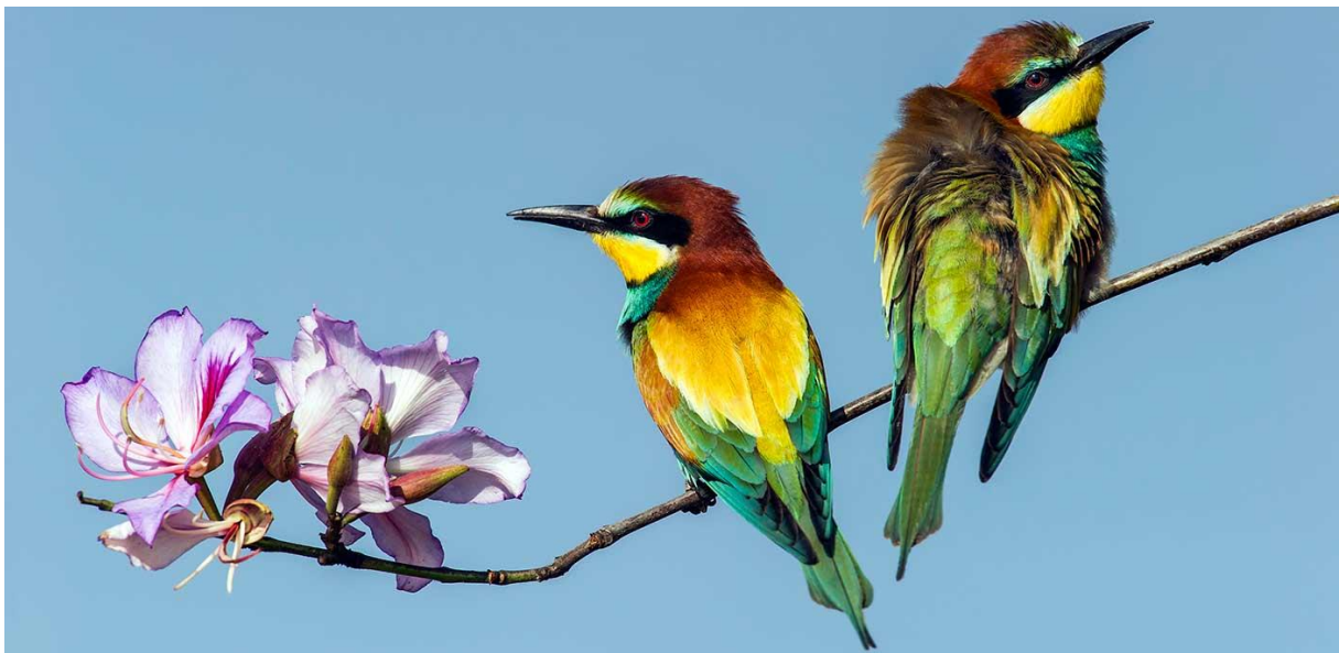
Un couple de guépiers d'Europe dans le parc ornithologique d'Eilat