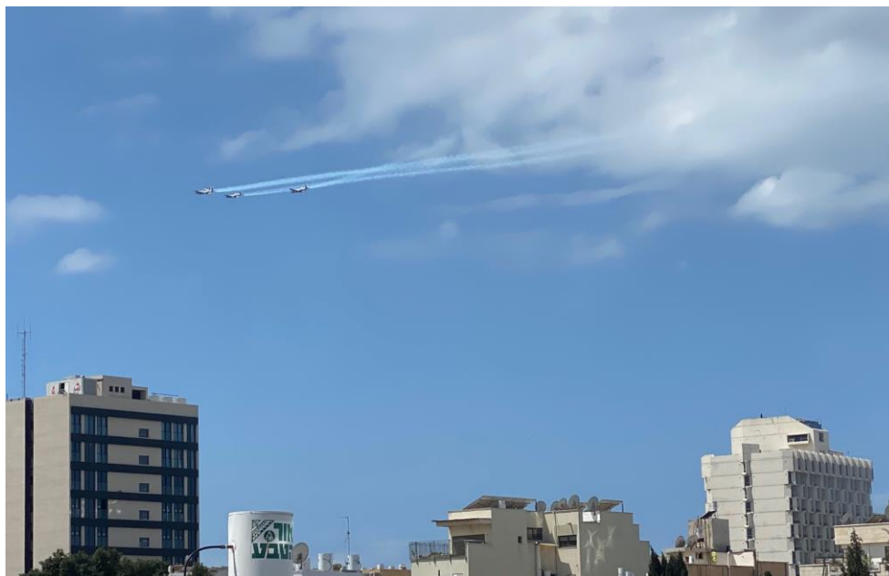
Les avions s'entraînent pour le spectacle aérien qui est offert à la population le jour de l'indépendance

Quand les pilotes s'entraînent pour la parade et que les escadrilles sillonnent le ciel israélien, chacun sait que Yom Ha'atzmaout (fête de l'indépendance) est proche. Même en 2020, quand le pays était en pleine crise sanitaire et qu'il était interdit de s'éloigner de son domicile de plus de 100 mètres, les avions ont survolé le pays, donnant à la population un semblant de normalité. Un an plus tard, une grande partie des Israéliens sont vaccinés, le taux de contamination est au plus bas et certains scientifiques estiment même qu'Israël est le premier pays au monde à avoir obtenu l'immunité de groupe. Il est donc possible de faire la fête et les raisons de se réjouir sont nombreuses malgré la situation politique toujours aussi bloquée. En effet, les nouvelles élections n'ont pas permis de dégager une majorité franche et les tractations vont bon train.