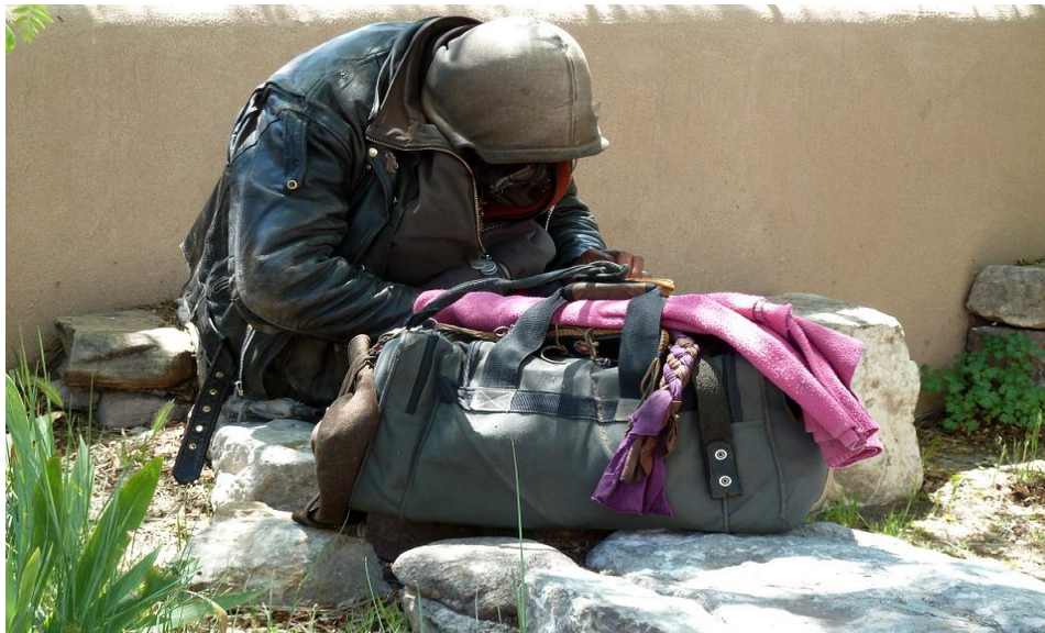
En Israël, ce sont des organisations à financement privé qui s'occupent de la plupart des sans-abri

Il est difficile d'obtenir des statistiques sur le nombre de personnes vivant dans la rue. Les sources officielles font état de 2 500 personnes, mais le chercheur et travailleur social Dr Shmuel Sheintoch a constaté que leur nombre est plus proche des 18 000. D'après Omri Abramovich les raisons pour lesquelles ces hommes et ces femmes finissent dans la rue sont multiples : la pauvreté croissante y contribue fortement mais l'alcoolisme et/ou la perte d'emploi ainsi que la consommation de drogues jouent également un rôle important. Toutefois, il faut noter que de nombreux sans-abri ne tombent dans la dépendance à l'alcool ou à la drogue qu'à partir du moment où ils se retrouvent à la rue.