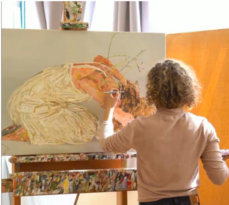
Fatma Shanan se peint elle-même sur ses tableaux qui sont vibrants et très recherchés (photo : Galerie DITTRICH & SCHLECHTRIEM).

Bien que les Druzes soient d'une loyauté absolue envers l'Etat d'Israël ils constituent une société relativement fermée et très traditionaliste. Les membres de cette communauté se marient généralement jeunes et uniquement entre eux. C'est pourquoi la plupart des Druzes israéliens ne vivent que dans des villes druzes.