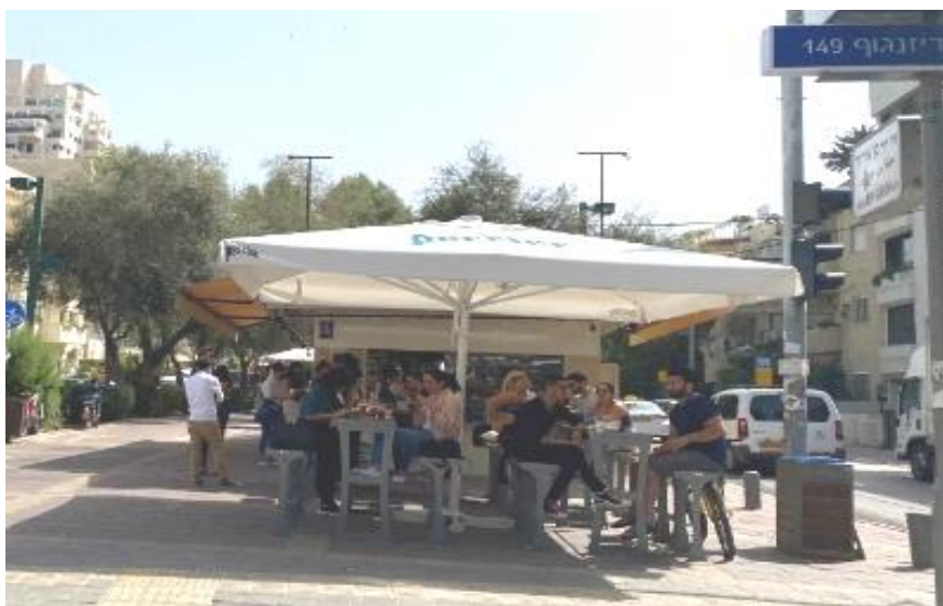
Café à Tel-Aviv. Les clients non vaccinés peuvent consommer en terrasse

Actuellement, le nombre de personnes vaccinées en Israël est de 5 millions. Depuis le pic de la troisième vague, mi-janvier, le taux de morbidité a diminué de 70 pour cent et le nombre de malades gravement atteints de 45 pour cent.