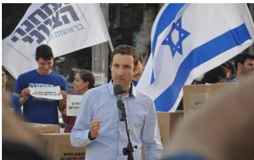
Le ministre israélien du Travail et des affaires sociales est très préoccupé par les coupes budgétaires dues aux prochaines élections (photo : Itzik Shmuli)

Plus de 200 000 personnes perçoivent une aide directe du ministère. Les coupes budgétaires auront entre autres pour conséquences dramatiques qu'on formera moins de travailleurs sociaux à une période où les violences domestiques, les abus de toutes sortes et la consommation de drogues atteignent des sommets. Or, les organismes sociaux sont déjà en sous-effectifs. Sur 600 postes dans les organismes pour adultes, 120 sont vacants et dans les organismes pour enfants sur 500 postes 80 sont vacants.