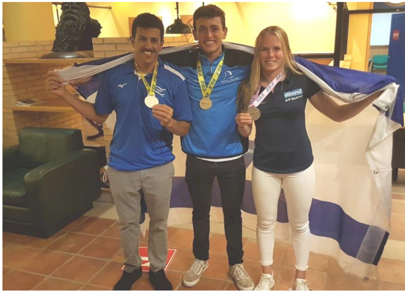
Les médaillés israéliens au championnat d'Europe de planche à voile (photo : Facebook Israel Sailing Association).

Le championnat permet de se qualifier pour les jeux olympiques de Tokyo qui devaient se tenir en mars mais ont été repoussés à cause du coronavirus. La planche à voile est la seule discipline dans laquelle un Israélien, Gal Fridman, a obtenu en 2004 la médaille d'or aux jeux olympiques d'Athènes. Les félicitations pour les succès au Portugal ne sont pas venues seulement de l'entraîneur de l'équipe masculine, Gur Steinberg. Ce dernier a parlé d' un assaut parfaitement réussi et il estime que sa vision d'une équipe au zénith sur le plan mondial s'est concrétisée . Le ministre de la Culture et des Sports, Chili Tropper, a également salué l'exceptionnelle performance des véliplanchistes israéliens.