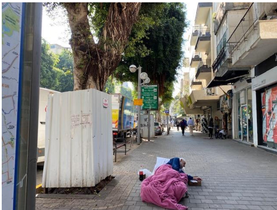
Personne sans abri à Tel-Aviv. Depuis le début de la pandémie, on voit davantage de sans-abris dans les rues de la ville.