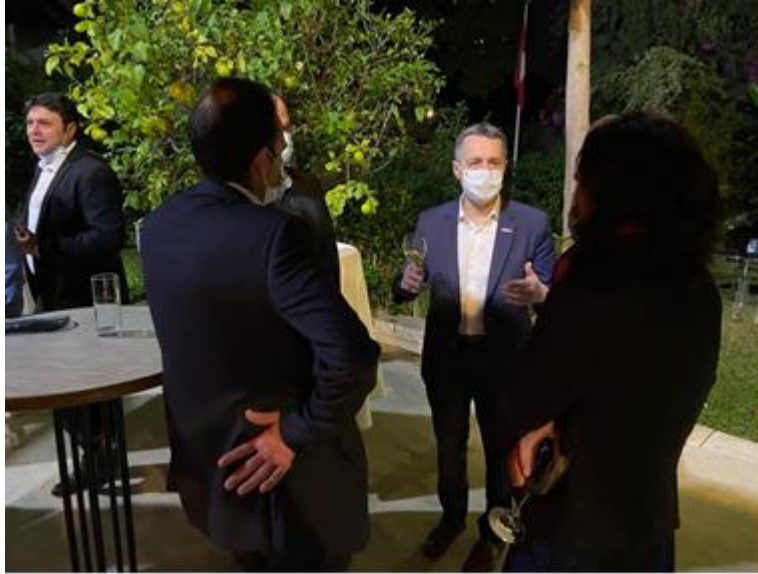
Le Conseiller fédéral Ignazio Cassis rencontre des entrepreneurs israéliens.

Lors d'une rencontre avec des entrepreneurs et des investisseurs israéliens, le Conseiller fédéral a pu personnellement constater la bonne santé et le dynamisme de l'écosystème de la nation des start up.