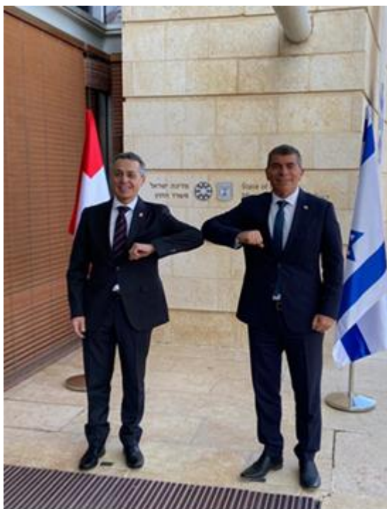
Le Conseiller fédéral Ignazio Cassis avec le Ministre des Affaires étrangères israélien Gabi Ashkenazi à Jérusalem.

L'un des outils de ce rapprochement est la coopération économique. Pour la Suisse, les start up et les innovations dans différents secteurs de recherche et dans différents domaines industriels sont essentiels pour stabiliser la région. Plusieurs exemples de coopération sous l'égide de la Suisse, par exemple l'étude commune des coraux dans la Mer Rouge et la fondation du Transnational Red Sea Research Center montrent que la diplomatie scientifique fonctionne effectivement.