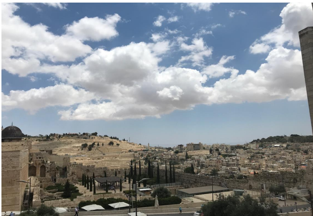
Vue sur le Mont des Oliviers. Il ne reste plus beaucoup d'espaces aussi peu construits à Jérusalem

A noter qu'un immense projet concernant l'ancienne gare de Jérusalem se rapproche déjà davantage du souhait des architectes. Un nouveau quartier high-tech va être construit à côté de la „Margalit Start-up City“. Il comprendra des immeubles d'habitation, un hôtel, des commerces, 4 000 mètres carrés de bureaux ainsi que des établissements de formation auxquels seront dévolus 7 500 mètres carrés.