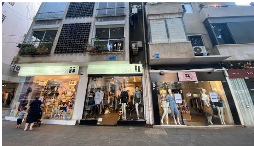
Magasins fermés sur Dizengoff à Tel-Aviv

Selon une étude de Dun and Bradstreet Israel durant le premier semestre 37 600 commerces ont été obligés de fermer dont 1500 bars, cafés et restaurants et 450 boutiques de vêtements et de chaussures. Les analystes supposent qu'environ 80 000 à 85 000 sociétés vont faire faillite cette année, soit 85 pour cent de plus qu'en 2019. Certains établissements font preuve de créativité pour contourner le confinement, par exemple en ajoutant à la gamme de leurs articles des produits dits essentiels comme ce magasin de vêtements situé à 'Holon qui vend maintenant aussi des fruits et des légumes ou en laissant leur établissement ouvert mais non accessible et en apportant aux clients qui restent à l'extérieur les articles souhaités.