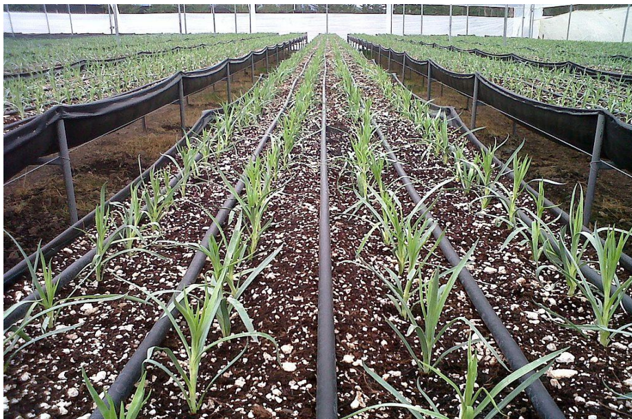
Irrigation par goutte à goutte de Netafim

Netafim, qui a été fondé en 1965, est un pionnier en matière d'irrigation par goutte à goutte. En 2017, Netafim a été racheté par la société chimique mexicaine Mexichem pour 1,5 milliard de dollars.