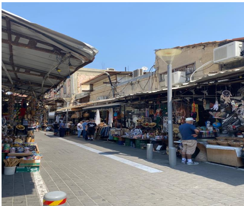
Toujours aucun touriste : dans les rues marchandes comme ici à Jaffa les commerçants se retrouvent entre eux

Depuis le début de l'épidémie, le taux de contamination chez les ultra-orthodoxes a fortement inquiété. L'ignorance de nombreux rabbins et maires de villes ultra-orthodoxes dont le seul objectif semble être de garder ouvertes les synagogues et les yeshivot (écoles religieuses) a encore aggravé la situation. Le fait que le Premier