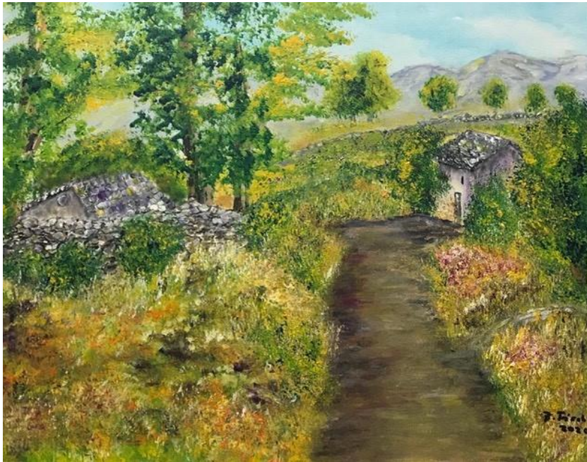
Tableau de Bracha Fischel

Les oeuvres de Bracha Fischel sont belles, paisibles, riches en couleurs et témoignent de son remarquable talent et de sa haute technicité. Elle peint des paysages de Suisse ou d'Israël, des fleurs, des arbres à l'aquarelle, à l'acrylique ou à l'huile.