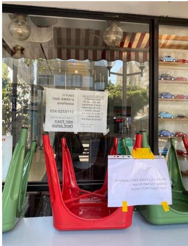
Pizzeria fermée à Tel-Aviv.

Les décisions de déconfinement et de retour au travail sont, pour certaines personnes, synonymes de survie. En effet, les cas de violence domestique ont explosé ces dernières semaines et, pour les femmes et les enfants concernés, retourner au travail ou à l'école signifie échapper à la violence.