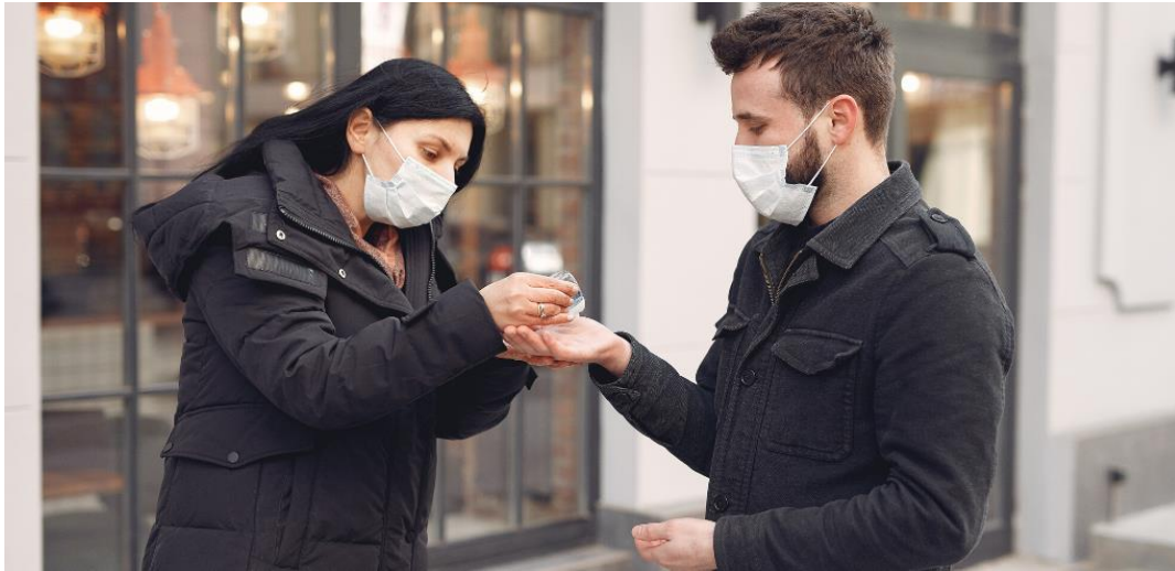
L'amour au temps de coronavirus (photo: Pexels).

On a ainsi une vraie chance de faire la connaissance d'une personne avec laquelle on s'entend vraiment bien, qui nous fait rire et avec laquelle on peut bavarder pendant des heures ce qui, en fin de compte, est la seule chose vraiment importante dans la vie.