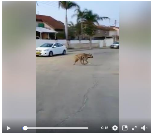
Une hyène rayée fait son petit tour dans un quartier résidentiel dans le sud du pays

Par ailleurs, la flore et la faune reprennent leurs droits. A Eilat, on a récemment observé des bouquetins sur la promenade normalement noire de monde. Dans le parc Hayarkon de Tel-Aviv, les chacals règnent en maîtres et, à Haïfa, on a vu une harde de sangliers dans un quartier résidentiel. Partout dans le pays, on entend de nouveau le chant des oiseaux. Sur les plages de Tel-Aviv, dont chaque centimètre carré est normalement occupé par beau temps, plusieurs espèces d'oiseaux qu'on ne voit normalement pas en ces lieux se sont confortablement installées.