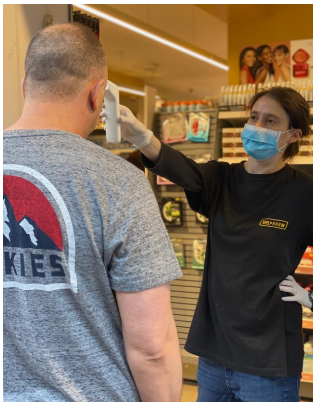
Une employée vérifie la température du client avant de le laisser entrer.