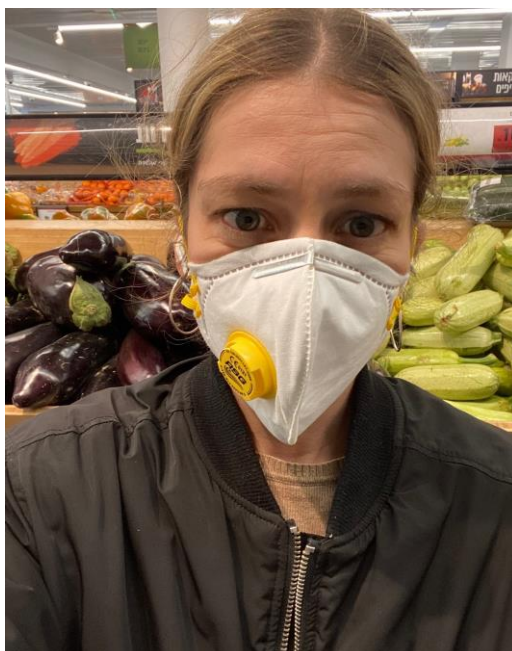
Achats au supermarché à l'heure du coronavirus