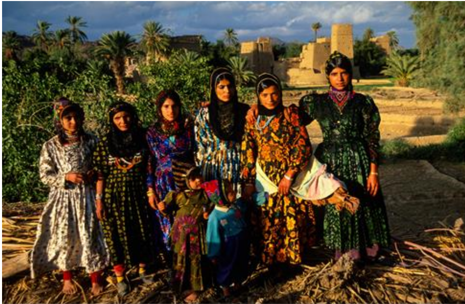
Festival de couleurs au Yémen