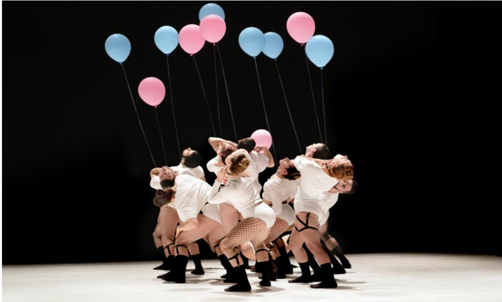
La compagnie de danse Fresco et son ballet 'Genderosity'.

Le talent incroyable des danseurs captive totalement le public, par exemple quand la troupe danse avec des ballons roses et bleus ,entre les sexes'. Le spectacle interroge également chacun sur sa propre vision de la masculinité, de la féminité et de l'intergenre et jette un regard nouveau sur le sens de l'amour, du genre et de la polyamorie. Lors de la préparation du spectacle, Yoram Karmi a discuté de ces sujets de manière approfondie avec ses danseurs en présentant des exposés et dans le cadre d'un véritable dialogue. Le but était de créer ensemble un spectacle offrant une vision 'généreuse' des nouvelles manières d'aimer, de s'exprimer dans la relation amoureuse et d'être. On retrouve d'ailleurs ce postulat dans le nom du spectacle, une association entre 'genre' et 'générosité'.