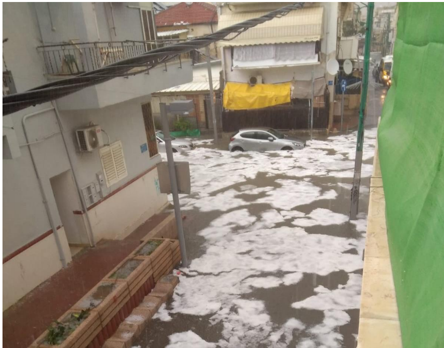
Inondation et grêle dans le sud de Tel-Aviv

Depuis son indépendance, le pays ne cesse de se développer. Les chantiers pullulent et de gigantesques projets d'infrastructures voient le jour (comme le train rapide reliant Tel-Aviv à Jérusalem terminé depuis peu après de nombreux retards). Rien que ces cinq dernières années, le pays s'est totalement transformé. Partout et pas seulement à Tel-Aviv de nouveaux quartiers sont créés. Les villes nouvelles poussent comme des champignons et les infrastructures ont du mal à suivre, notamment dans le centre du pays. Les voies d'accès sont insuffisantes, de même que les transports publics et, surtout, on déplore l'absence de structures et de réglementations.