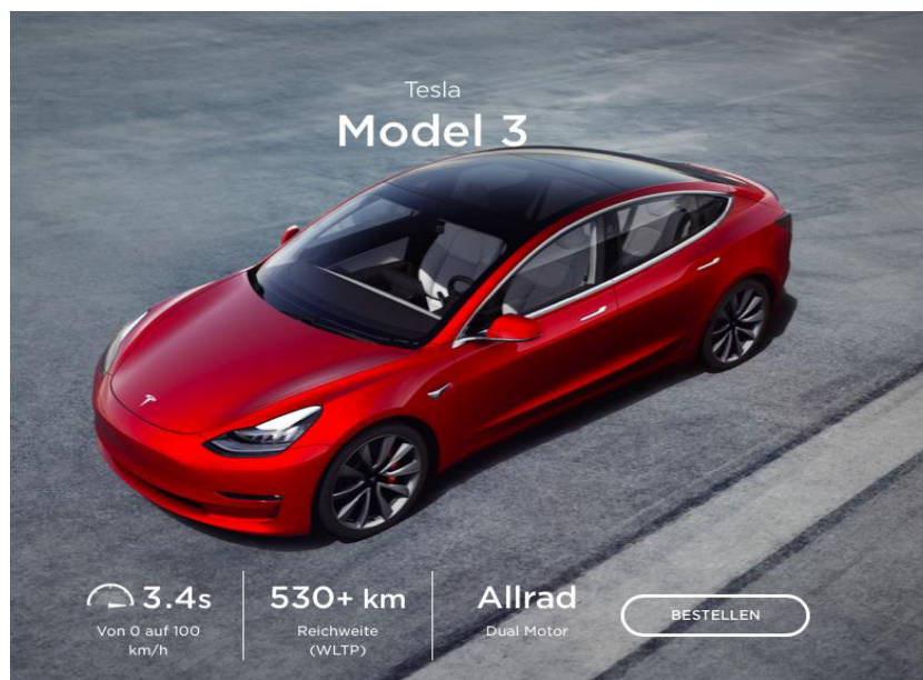
Le modèle 3 de Tesla sera vendu prochainement en Israël.

Parallèlement, Tesla va ouvrir un centre de recherche et développement en Israël qui se concentrera au début sur la prospection de start up intéressantes dans le domaine des technologies automobiles. On estime également que Tesla pourrait embaucher d'autres collaborateurs en Israël pour plancher sur de nouvelles technologies en étroite coopération avec le centre de recherche et développement de Palo Alto.