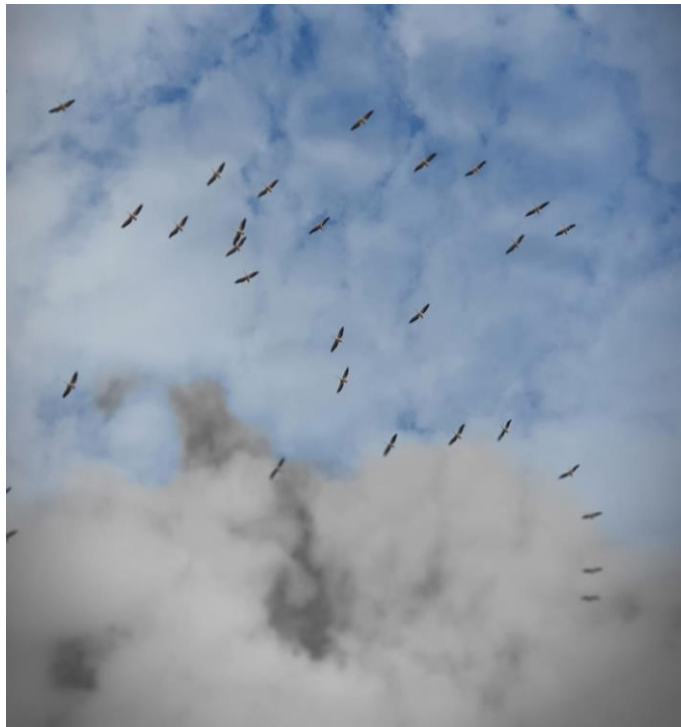
Oiseaux dans le ciel d'Israël.