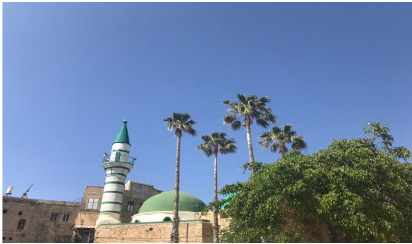
Saint-Jean-d'Acre fait partie des villes qui bénéficieront du programme d'innovation urbaine de Michael Bloomberg.