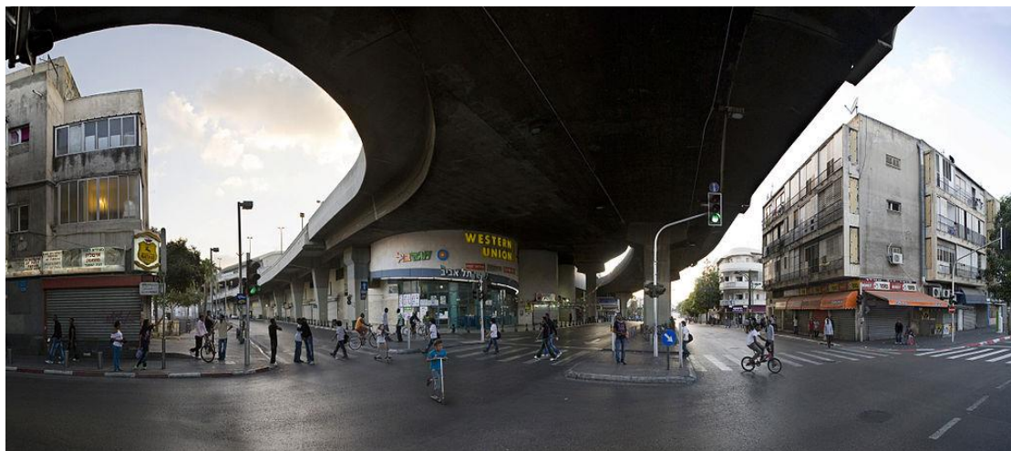
Rue sous la gare centrale d'autobus à Tel-Aviv

A en croire la municipalité, les années de délaissement de ces quartiers sont maintenant terminées. Un plan de développement très complet a été accepté récemment. Il prévoit non seulement la construction de logements mais également l'implantation de commerces et d'équipements publics. C'est la première fois depuis plus de dix ans qu'un projet de développement voit le jour pour Neve Shaanan. Ce quartier très hétérogène avec un fort taux de criminalité est également très pauvre et extrêmement délabré. 70 pour cent de ses habitants sont des réfugiés et des demandeurs d'asile. Ces dernières années, un nombre croissant de start up à vocation sociale ont découvert la gare centrale d'autobus au centre de ce quartier et ont développé des concepts nouveaux pour améliorer l'attractivité de la gare pour les résidents, par exemple l'installation d'un jardin sur le toit de la gare et la mise en place d'équipements artistiques.