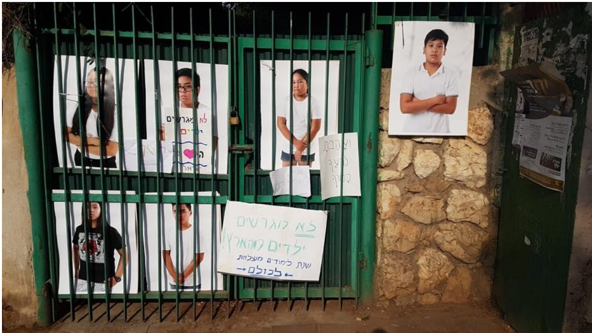
Affiches dénonçant l'expulsion d'enfants de travailleurs étrangers.