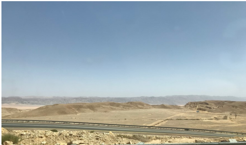
Paysage de cratères dans le désert du Néguev.

De forme pratiquement circulaire le cratère, d'une longueur de huit kilomètres et d'une profondeur de 400 mètres, est le plus à l'est des monts du Néguev.