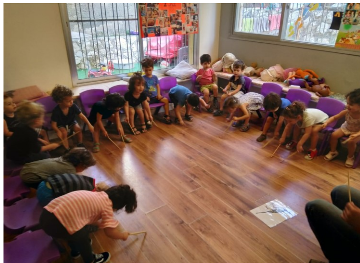
Des enfants heureux dans une crèche privée .

En Israël, les jardins d'enfants d'Etat sont ouverts aux enfants seulement à partir de trois ans. Le congé maternité n'étant toutefois que de trois mois, la plupart des parents n'ont d'autre recours que la crèche privée qui coûte entre 700 et 1000 euros par mois, soit une importante charge financière pour les parents. De plus, ces crèches ne sont pas assujetties à des règles de fonctionnement spécifiques, le nombre d'assistants ou d'assistantes maternels est généralement insuffisant, le personnel change souvent et les lieux sont fréquemment trop étriés pour le nombre d'enfants accueillis.