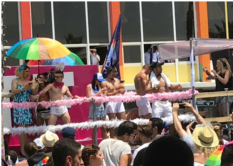
Participants à la parade de la fierté à Tel-Aviv en 2018.

Cette semaine, la parade de la fierté se tiendra à Tel-Aviv qui attend des centaines de milliers de visiteurs d'Israël et du monde entier. Tel-Aviv est en effet depuis toujours le centre de la communauté LGBTQ en Israël. Lors de la parade, qui a lieu chaque année, toute la ville est en liesse pendant plusieurs jours. Des entreprises, ambassades, organisations, etc. sont représentées au défilé par des camions et des remorques décorés et hauts en couleur.