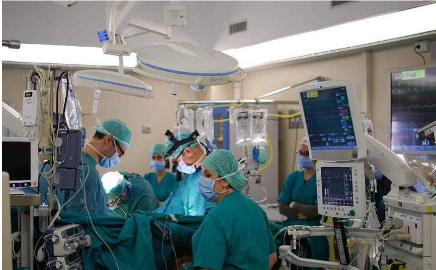
Chirurgiens effectuant une opération du coeur.

Dans le passé, les médecins pouvaient tout au plus s'exercer sur des animaux ou des cadavres. La technologie en 3D permet une formation par simulation, analogue à celle des pilotes.