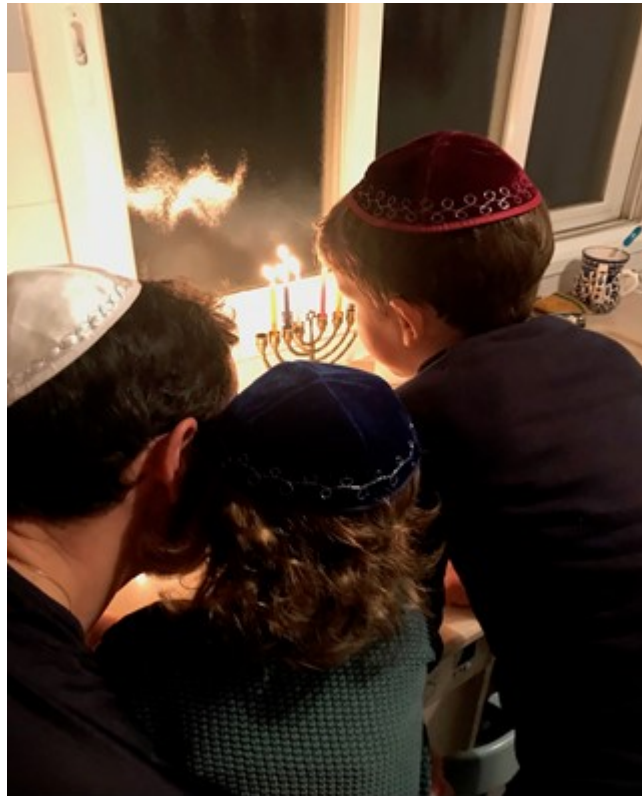
Porter la kippa est dangereux en Allemagne. Etre Juif a fortiori

au danger en Israël. On se protège à n'importe quel prix, de la manière qui semble la plus appropriée. Il serait peut-être bon que les Allemands montrent un peu de cette détermination dans leur combat contre l'antisémitisme.