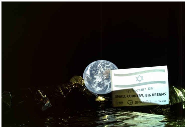
Selfie envoyé de l'espace.