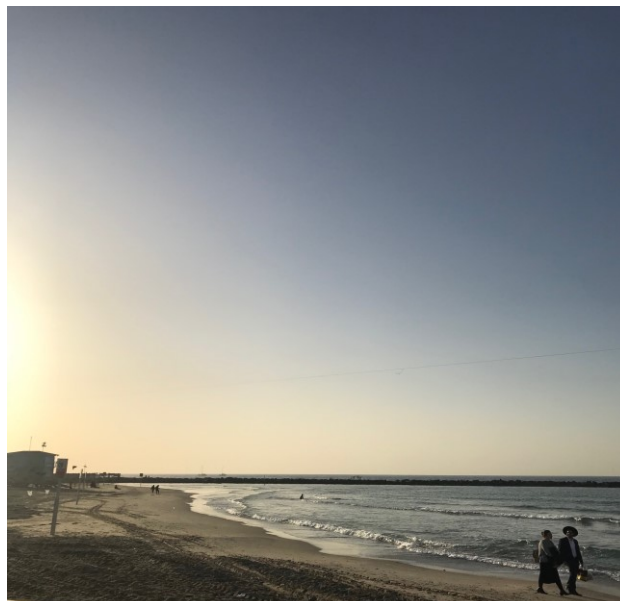
„Dans l'attente d'une bouteille venant d'Allemagne – à la plage de Tel Aviv“

La télévision israélienne a rapporté hier l'histoire d'une bouteille à la mer qui a été jetée en Grèce par un jeune Allemand et trouvée par un petit Israélien sur une plage en Terre Sainte. Les deux familles (notamment la famille allemande qui a réagi avec beaucoup d'émotion à la réponse israélienne) sont maintenant en contact et comptent se rendre mutuellement visite. Une bouteille à la mer pour répondre à toutes mes questions ? Et pourquoi pas ?