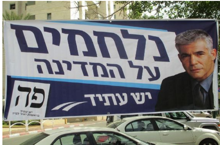
Beau gosse mais naïf, c'est le reproche fait régulièrement à Yaïr Lapid, politicien du centre

politicien, souvent formulé à l'encontre du principal concurrent de Bibi : Yaïr Lapid). Toutefois, Gantz ne pouvant apparemment s'identifier à l'idéologie d'aucun parti existant ou accepter les différentes idéologies en place, il a créé un nouveau parti „Resilience Party“ qui ne volera probablement que quelques voix au Likud (le parti de Bibi) et minimisera le succès de „Yesh Atid“ (le parti de Yaïr Lapid qui signifie à peu près „il y a un avenir“) ou des „Nouvelles droites“ (également un nouveau parti créé par Naftali Bennett et Ayelet Shaked, membres de la coalition gouvernementale actuelle). Les „Nouvelles droites“ doit réunir les courant laïcs et religieux et ainsi détrôner le roi Bibi (comme on l'appelle en Israël). On peut douter du succès de l'entreprise.