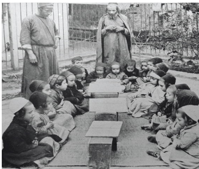
Enfants étudiant la Torah à Jérusalem. La photo date de 1925

28.000 photographies retraçant l'histoire d'Israël avant la création officielle de l'Etat en 1948 sont désormais disponibles au public sur la plateforme Wikimedia Commons (dont fait également partie Wikipedia). Les photographies viennent à la fois d'archives privées et d'archives publiques et elles montrent le retour des Juifs au fil des années sur la terre de leurs ancêtres.