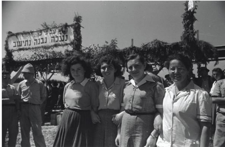
Jeunes femmes de l'organisation Bnei Zion (1947) en Israël

vient d'être construit. Les photos ont toutes été prises avant 1947 et ne sont donc plus soumises aux droits d'auteur, conformément à la législation israélienne. Pour réaliser ce projet, l'entreprise Wikimedia a développé un processus de scannage qui recherche dans les archives en ligne les photos libres de droit. Ces photos sont ensuite téléchargées sur le serveur de Wikimedia Commons et peuvent être consultées par n'importe quel visiteur du site. A noter toutefois que les différents services d'archives n'ont pas tous apprécié cette façon de procéder, notamment le Central Zionist Archive qui s'est plaint au media Calcalist que Wikimedia avait pris les photos sans son accord.