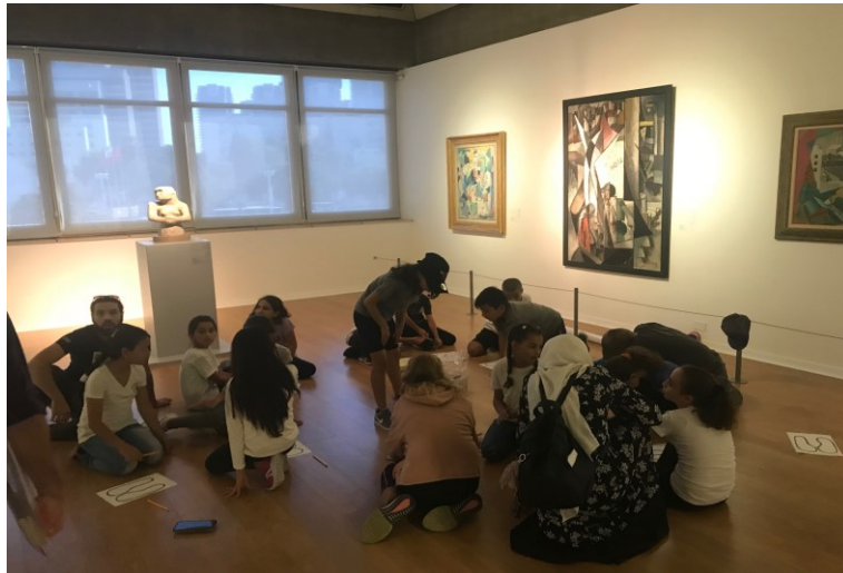
Les élèves arabes et juifs travaillent ensemble à une oeuvre sur les contradictions