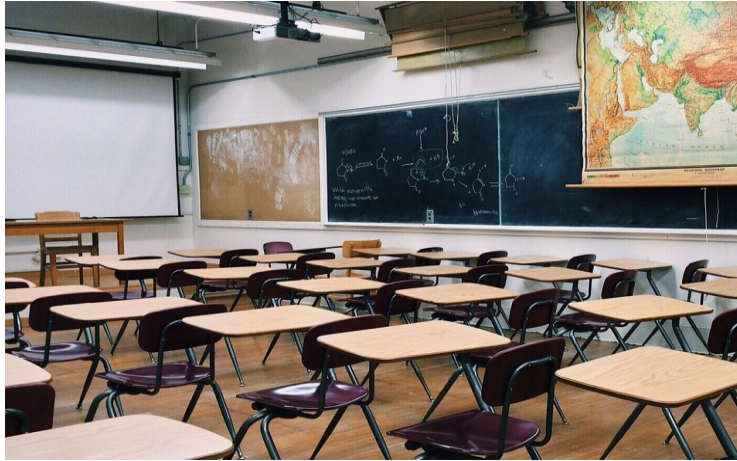
La violence est hélas fréquente dans les écoles photo: Pixabay)