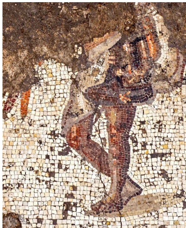
Un fragment de la mosaïque mise à jour

Des fouilles sur un site remontant à l'époque byzantine dans le parc national de Césarée ont permis de découvrir une belle mosaïque datant de dix-huit siècles dans un remarquable état de conservation. D'après l'un des responsables des fouilles, cette mosaïque de trois mètres et demi de large sur huit mètres de long appartenait soit à un bâtiment public, soit à une maison privée et c'est la première fois que les archéologues trouvent en Israël ce genre de mosaïque offrant une telle qualité qui témoigne d'un savoir-faire comparable à celui des artisans ayant réalisé en leur temps les célèbres mosaïques romaines d'Antioche.