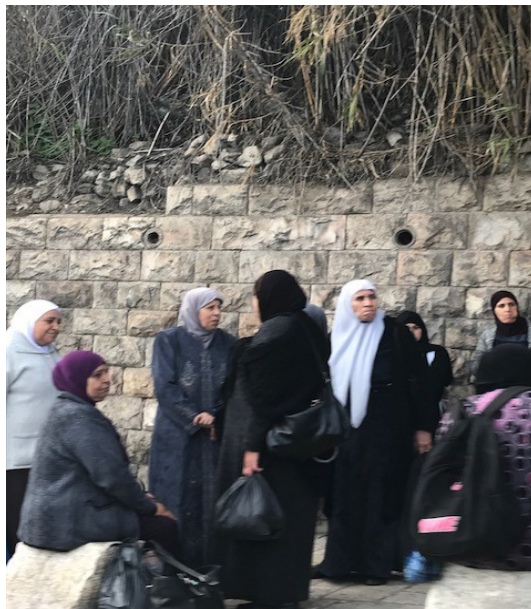
Femmes arabes à Jérusalem

Il est regrettable que l'amélioration de la formation n'aille pas de pair avec l'entrée sur le marché du travail. Seuls 34 pour cent des Arabes israéliennes entre 25 et 64 ans travaillent. D'ici 2020, le gouvernement veut porter ce chiffre à 41 pour cent. Toutefois, étant donné que les statistiques montrent que les femmes arabes ayant étudié sont maintenant plus nombreuses à exercer ensuite un métier, on peut espérer que le marché du travail ressentira à l'avenir les effets de cette formation plus poussée.