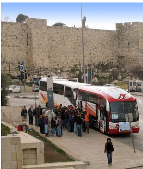
Car de tourisme devant les murs de la vieille ville de Jérusalem.