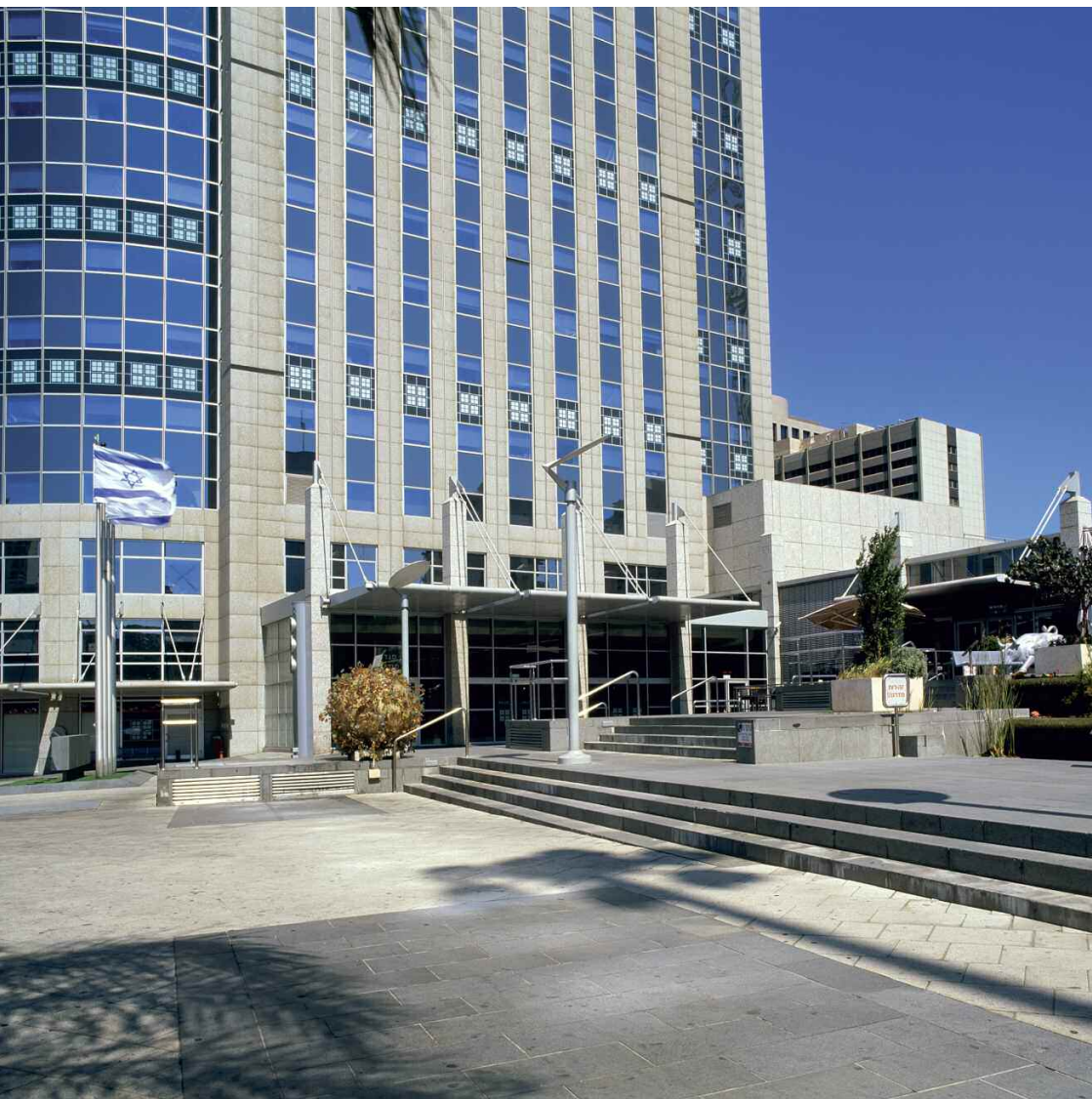
Bourse aux Diamants, Ramat Gan