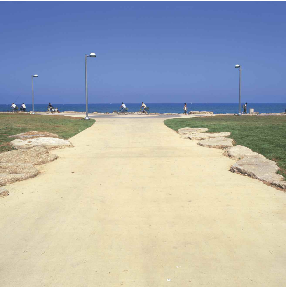
Tel Aviv Jaffa