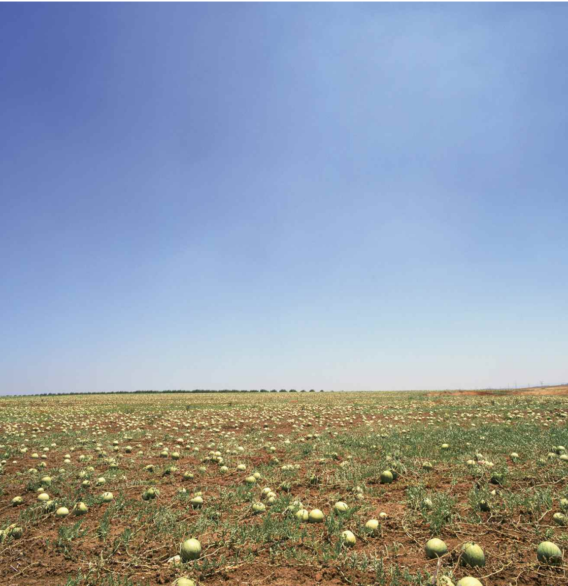
Désert du Néguev